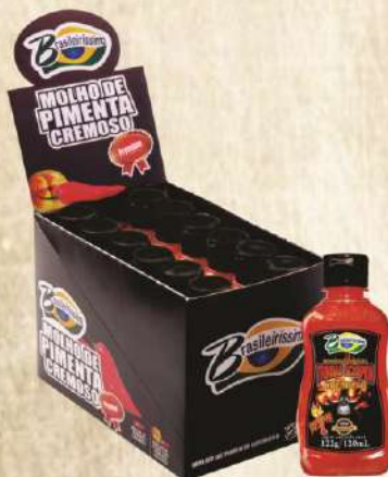
MOLHO DE PIMENTA TRINIDAD SCORPION CREMOSO 3250 CAIXA: 12x120ml (DISPLAY) Cód. PRIM. 789856085275-6 Cód. SEC. 1789856085275-3