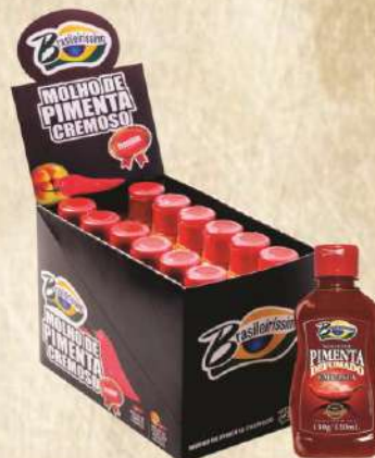
MOLHO DE PIMENTA DEFUMADO EM PASTA 3251 CAIXA: 12x120ml (DISPLAY) Cód. PRIM. 789856085267-1 Cód. SEC. 1789856085267-8