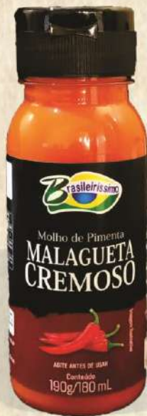
MOLHO DE PIMENTA MALAGUETA CREMOSO 3316 CAIXA: 12x180ml CÓD. PRIM. 789856085400-2 CÓD. SEC. 1789856085400-9