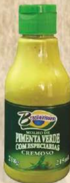
MOLHO DE PIMENTA VERDE COM ESPECIARIAS CREMOSO 3292 CAIXA: 12x215ml Cód. PRIM. 789856085351-7 Cód. SEC. 1789856085351-4