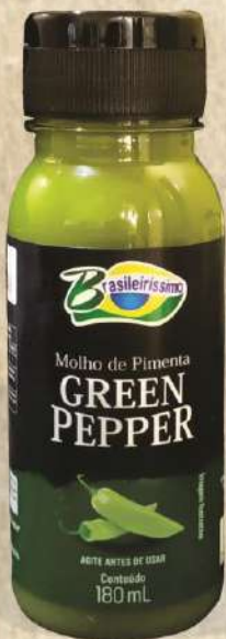
MOLHO TIPO TABASCO