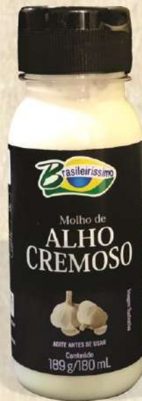
MOLHO DE ALHO CREMOSO 3317 CAIXA: 12x180ml CÓD. PRIM. 789856085398-2 CÓD. SEC. 1789856085398-9