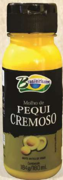
MOLHO DE PEQUI CREMOSO 3315 CAIXA: 12x180ml CÓD. PRIM. 789856085399-9 CÓD. SEC. 1789856085399-6