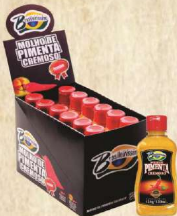
MOLHO DE PIMENTA CREMOSO 3157 CAIXA: 12x120ml (DISPLAY) Cód. PRIM. 789856085230-5 Cód. SEC. 1789856085230-2