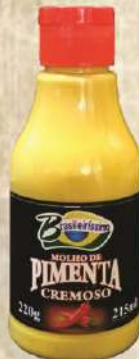
MOLHO DE PIMENTA CREMOSO 3291 CAIXA: 12x215ml Cód. PRIM. 789856085350-0 Cód. SEC. 1789856085350-7