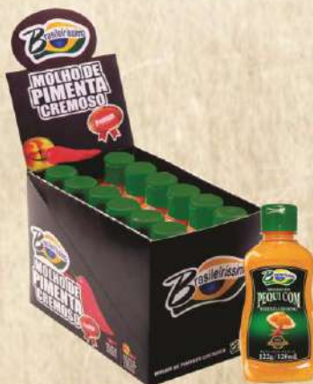
MOLHO DE PEQUI COM PIMENTA CREMOSO 3158 CAIXA: 12x120ml (DISPLAY) Cód. PRIM. 789856085229-9 Cód. SEC. 1789856085229-6