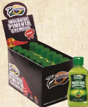
MOLHO DE PIMENTA VERDE COM ESPECIARIAS CREMOSO 3253 CAIXA: 12x120ml (DISPLAY) Cód. PRIM. 789856085269-5 Cód. SEC. 1789856085269-2