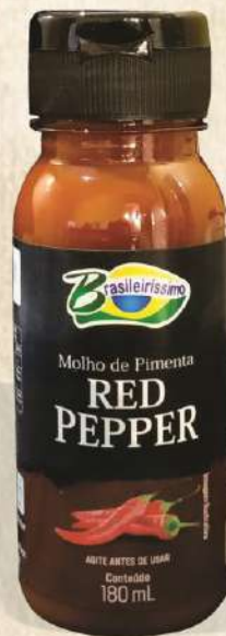
MOLHO TIPO TABASCO