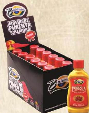
MOLHO DE PIMENTA CASEIRO CREMOSO 3248 CAIXA: 12x120ml (DISPLAY) Cód. PRIM. 789856085264-0 Cód. SEC. 1789856085264-7